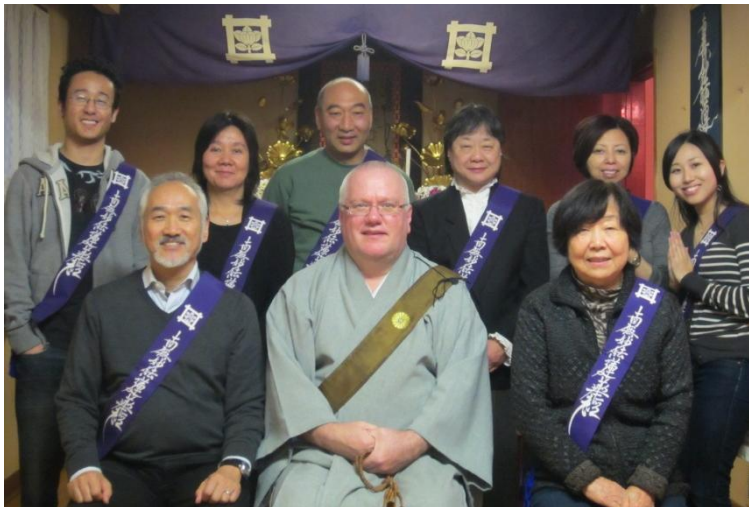
お寺での法要にて☆November 28 th , 2011☆Temple Service