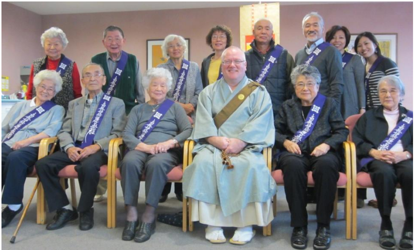
もみじでの法要にて☆November 28 th , 2011☆Momiji Service

☆Meeting: SUN January 22 nd 2~3pm We will be planning our service schedule for this year. We look forward to seeing you!